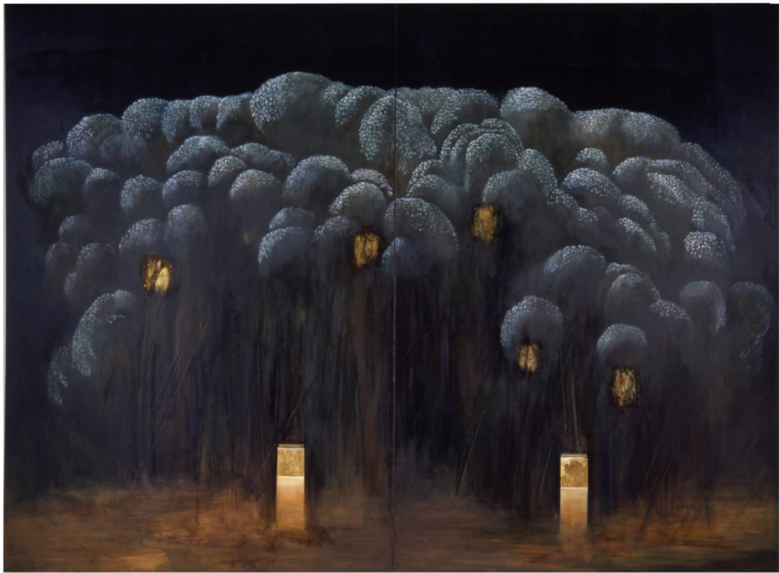
夜晚的竹村 Nights In The Bamboo Villages 196 x 260 cm 1996