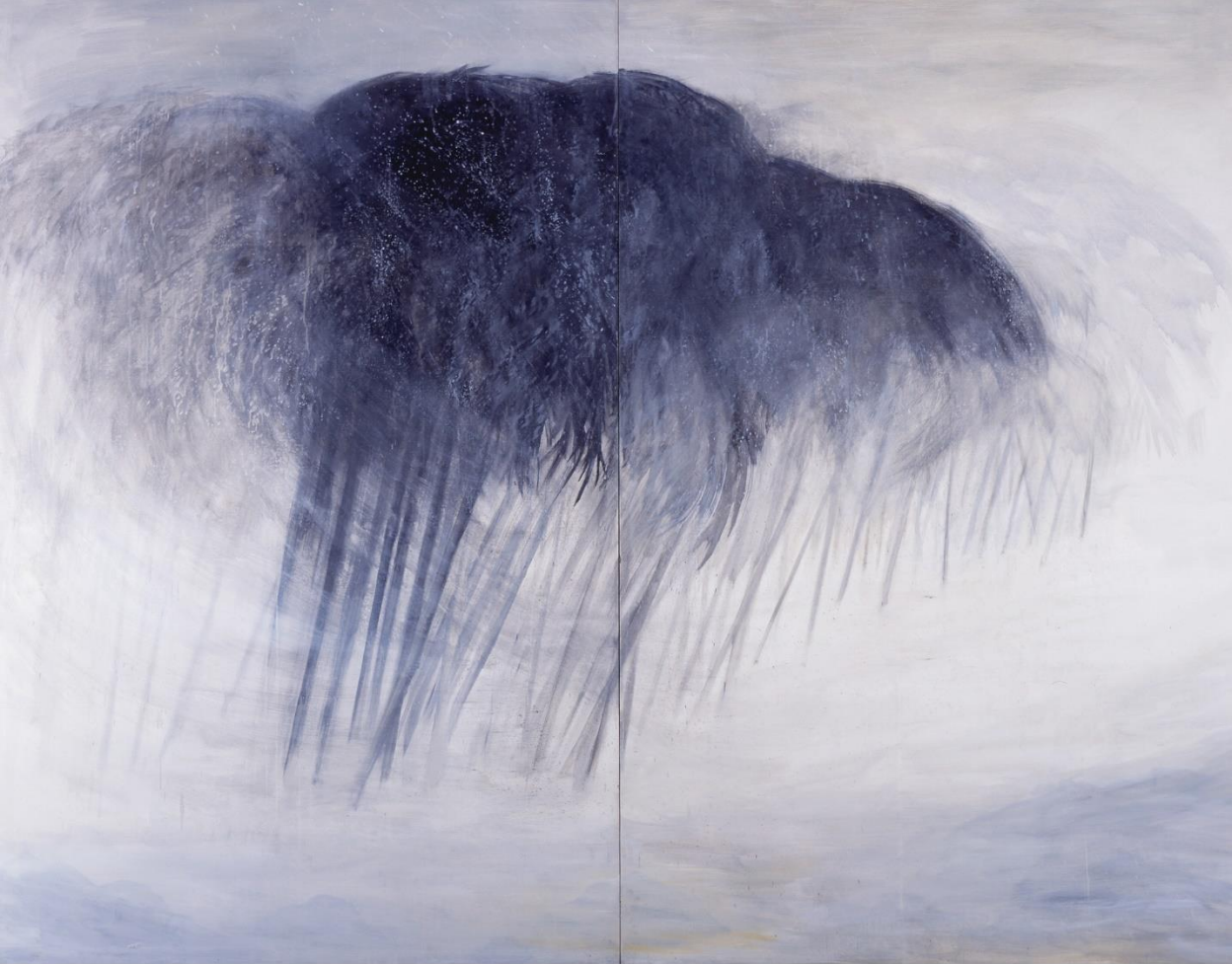
冬天的別墅 Winter Villa 260x 196 cm 2001