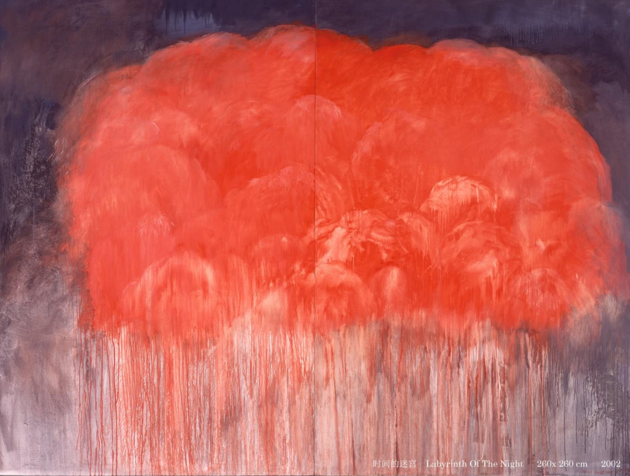
时间的迷宫 Labyrinth Of The Night 260x 260 cm 2002