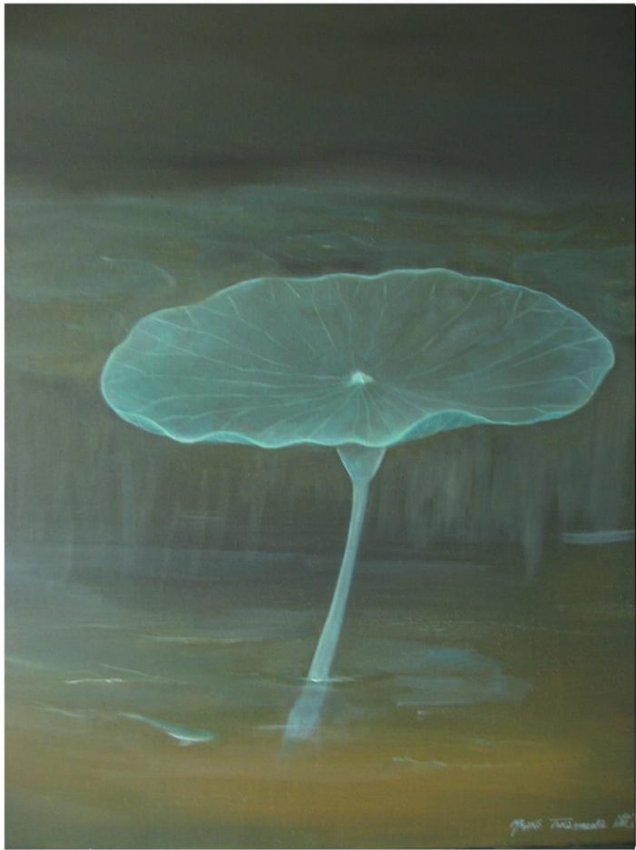
清澈的夜·梦中的鱼 Transparent Night 55 x 46.7 cm 2007