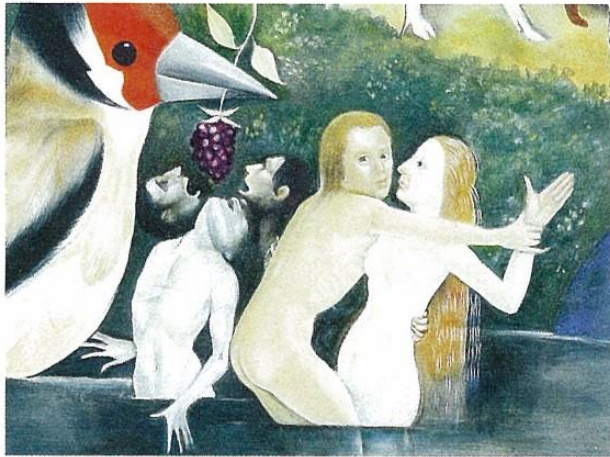
「快樂の園」部分 “アダムとイヴ” 1989～1994